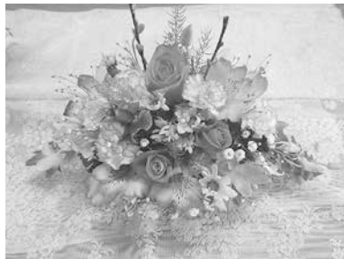
フラワーアレンジメント（作品例）