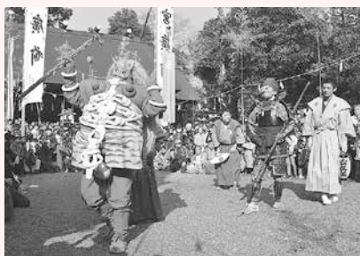
赤鬼と天狗のからかいのようす