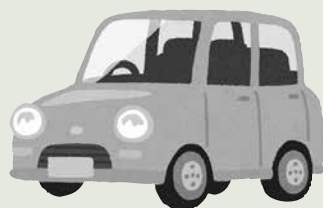
■表1 三輪および四輪以上の軽自動車税

軽自動車関連税制の見直しが行われ、三輪および四輪以上の軽自動車や原動機付自転車、二輪、小型特殊自動車の税率が変更となります(表1・2)。また、最初の新規検査から13年を経過した四輪車両などについては平成28年度から新税率の約20%の重課となります。併せて平成27年4月1日～平成28年3月31日に最初の新規検査を受けた四輪車両などで、排出ガス・燃費性能の優れた環境負荷の小さいものは、平成28年度の税率を軽減する特例措置「グリーン化特例(軽課)」(表3)が適用されます。