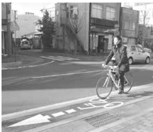
札幌通りの自転車通行空間

市では、車道の左端に青いラインや自転車マークなどを標示し、自転車が走りやすい道路環境の整備などを進めています。実際に整備された道路を走って、その安全性や快適性を体感してみてください。