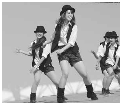
ええじゃないか豊橋伝播隊 DOEE

とき: 3月6日(日)午前10時～午後3時30分 ところ: 勤労青少年ホーム(神野ふ頭町ライブポートとよはし内) 内容: ヨガ・アロマセラピーなどの体験講座や受講生の作品展示、ええじゃないか豊橋伝播隊DOEEのパフォーマンスや音楽演奏、フリーマーケットやフィナンシャル・プランナーによる暮らしとお金のセミナーなど 参加料: 無料(一部の体験講座は材料費必要) その他: 詳細はホームページ( http://www.city.toyohashi.lg.jp/8989.htm )参照。平成28年度前期教養講座の予約を受け付けます(詳細は本紙3月1日号に掲載予定) 申し込み: 不要(体験講座は事前予約可) 問い合わせ: 勤労青少年ホーム(☎33・0555 国kinroseisyonen-home@city.toyohashi.lg.jp)