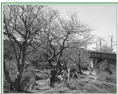
秋のさくらまつりのようす

トヨッキー基金への寄附は、随時受け付けしています。この基金への寄附は税金の優遇措置があります。詳細は市民協働推進課(☎51・2483) http://www.city.toyohashi.lg.jp/5230.htm