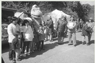
わいわい消防広場のようす

とき 2月21日(日)午前10時～午後1時 ところ 向山緑地内梅林園(うめまつり会場内) 内容 消防本部イメーჯキャラクター「ヒゲッシー」・消防団イメーჯキャラクター「ワットくん」の写真撮影コーナー、消防音楽隊とホワイトシーガルスによる演奏・演技など