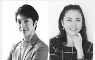
野村萬斎、鈴木砂羽

とき:6月25日(土)・26日(日)午後1時開演 内容:W.シェイクスピアの四大悲劇「マクベス」を、野村萬斎構成・演出により、5人の出演者で描きます 出演:野村萬斎、鈴木砂羽ほか 入場料:S席7,000円、A席5,000円、B席3,000円、24歳以下1,500円、高校生以下1,000円 チケットの販売:一般/3月19日午前10時からプラットチケットセンター、チケットぴあ(☎0570・02・9999/PCコード:449-074J)ほか、会員先行/3月5日午前10時からプラットチケットセンター