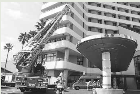
消防訓練のようす

市内一斉にサイレン吹鳴(午後8時) 高齢者世帯などの防火診断 消防訓練・防火査察