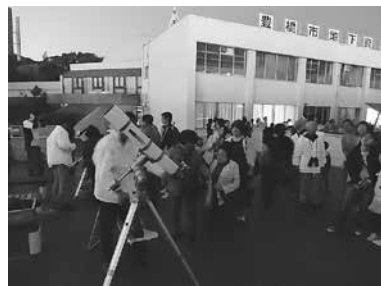
星空観望会のようす

とき: 3月12日(土)午後6時30分～8時 ところ: 地下資源館屋上(大岩町字火打坂) 対象: どなたでも(中学生以下は保護者同伴) 内容: 地球の反射光によって照らされた月と木星、冬の星座などを観望します(天候不順の場合はプラネタリウムで解説します) 定員: 80人(申込順) 参加料: 無料 持ち物: 懐中電灯、あれば双眼鏡・星座早見盤 申し込み: 2月20日午前9時から視聴覚教育センター(☎41・3330)