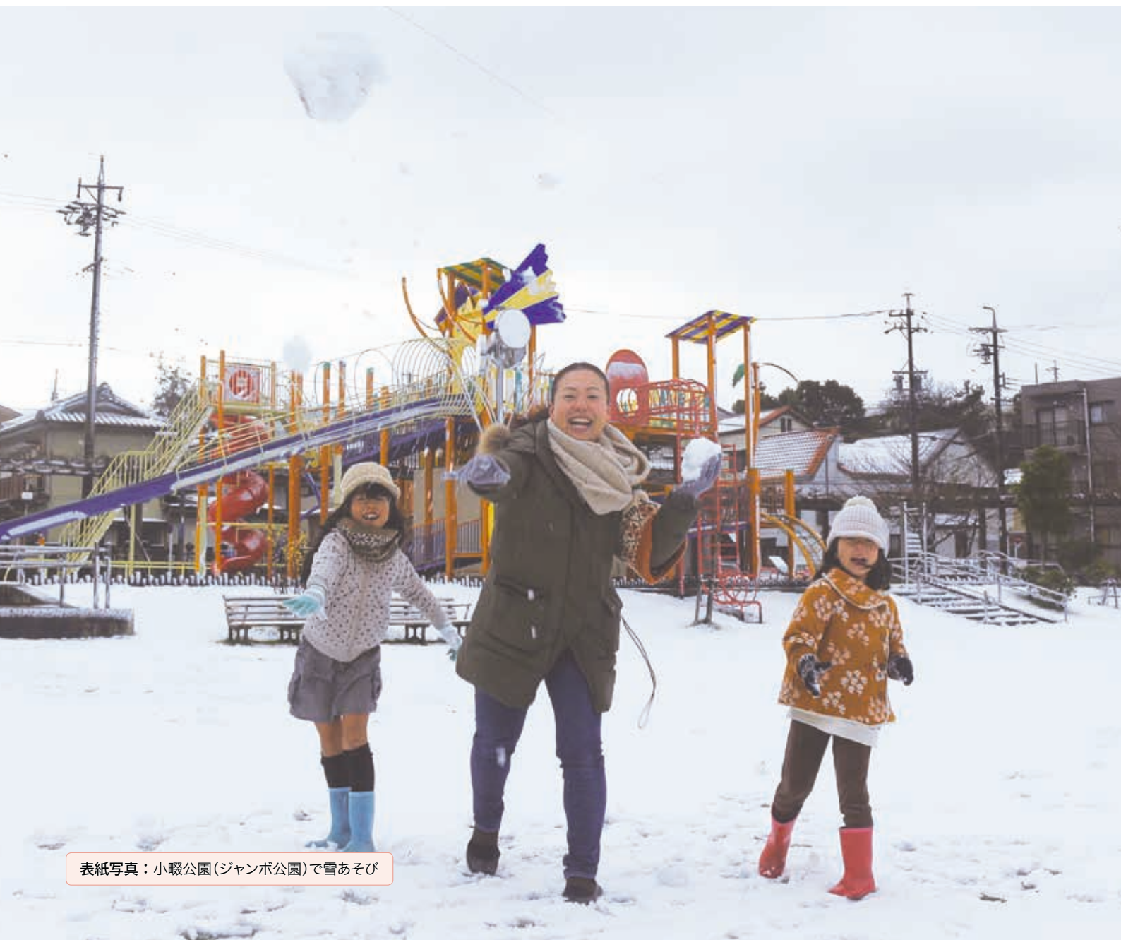
表紙写真：小畷公園(ジャンボ公園)で雪あそび