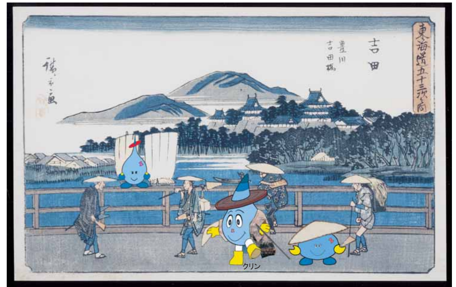
吉田宿と豊橋市下水道キャラクター「クリン」親子 豊橋市は、むかしから豊川とふれ親しんでいました。

上下水道局では、川や地下水から水を取り入れ、安全な水道水として家庭などに送り、家庭や工場から出た汚れた水を、きれいにして川や海へ返す、「水の循環」に取り組んでいます。これからも、『水』を通して市民生活の「安全性」と「安定性」を目指していきます。