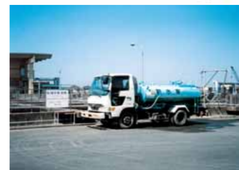
中島処理場で処理水を積む散水車