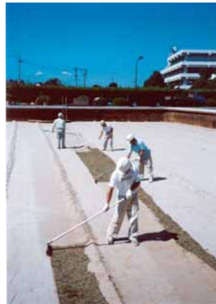
小鷹野浄水場でのろ過池の除砂作業