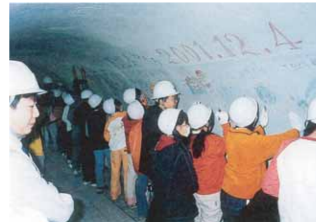
平成13年12月下地小児童による下地雨水幹線への落書き会

注)合流式下水道・雨水と汚水と同じ下水道管で流すシステム。現在は、別々に流す分流式で整備しています。