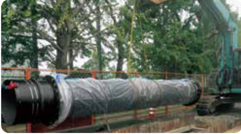
地震に強い大きな水道管の設置