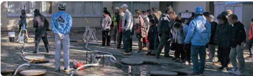
飲料水兼用耐震性貯水槽を使った防災訓練

災害時に備えて市内26か所に設置された飲料水兼用耐震性貯水槽を使った防災訓練を地元住民の皆さまと一緒に実施しています。