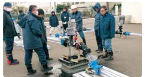
水道管の配管技術