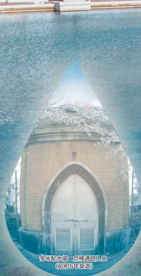
多米配水場 点検通路入口 (昭和5年築造)