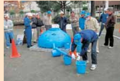
給水訓練(羽根井公園)