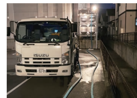
病院の給水タンクへ応急給水

豊橋市も近隣市と同様に老朽化した水道管・下水道管が多くあり、交通量など様々な要因によって破損・漏水することがありますので、市民生活に大規模な影響が起らないように計画的に施設の更新等を進めていきます。