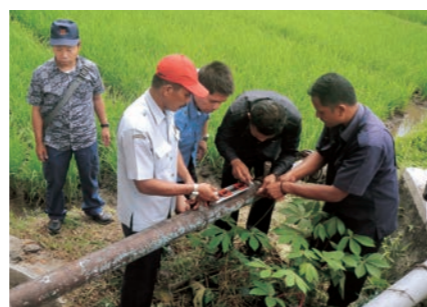
水道管の漏水検査について技術講習