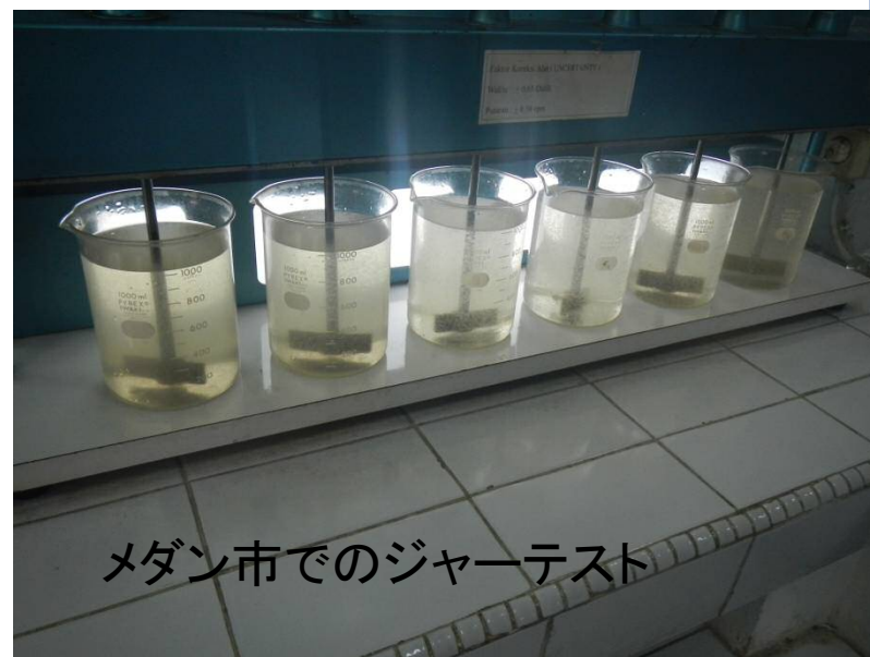
メダン市でのジャーテスト