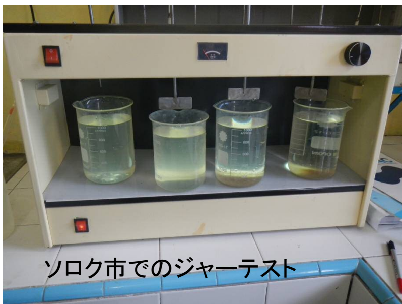
ソロク市でのジャーテスト