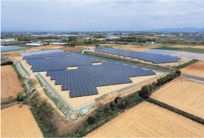
メガソーラー発電所

太陽光発電システムなどの環境に配慮したエネルギー利用や自動車と公共交通、自転車、徒歩などをかきこく使い分けるライフスタイルの推進など、地球温暖化対策を進め、二酸化炭素の排出が少ない低炭素社会*を実現することにより、恵まれた環境を将来の世代に継承し、地球環境の保全に寄与することを目指します。