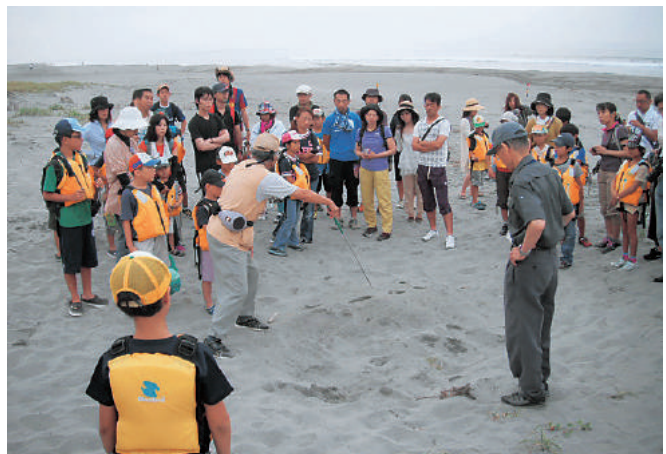
表浜での自然観察会

このような認識のもと、環境保全に関する教育や啓発を進めることで、私たち一人ひとりの環境に対する意識を高めるとともに、市民活動などを通じて地域の文化を守り、継承し、自然や将来世代を思いやる知恵をはぐくむ文化環境の形成を目指します。