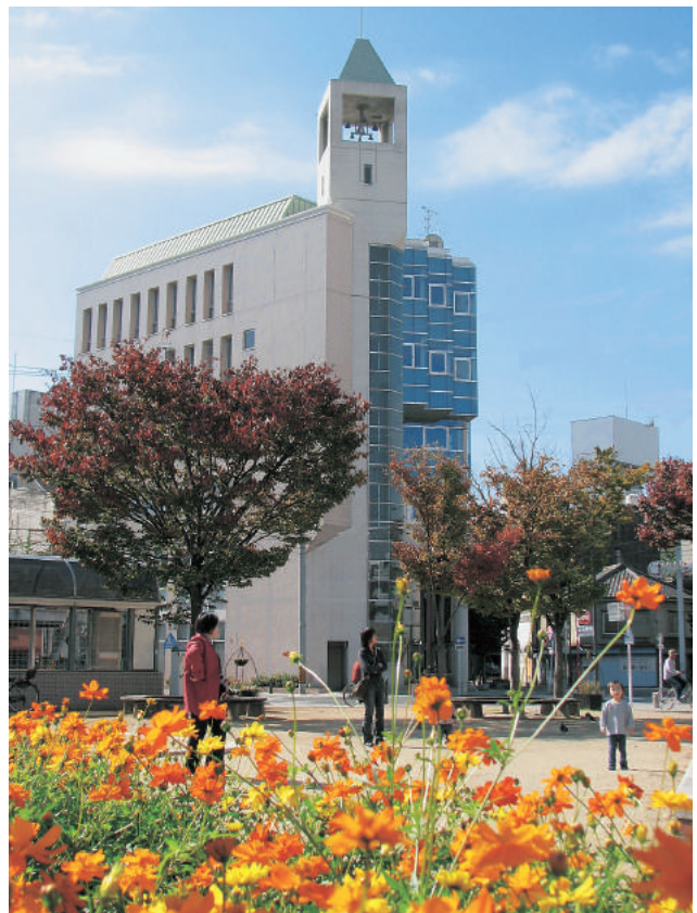
松葉公園とカリオンビル