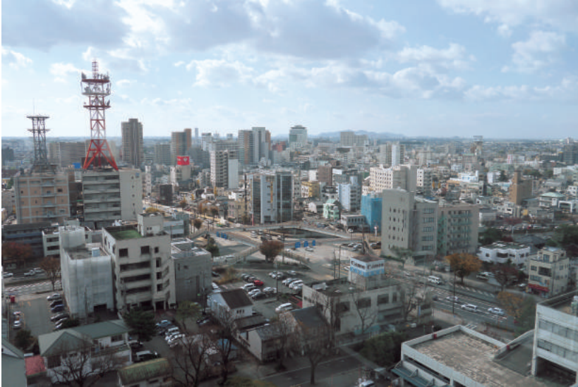
豊橋市のまちなみ

大気や水、土壌などが良好な状態に保たれていることは、私たちが健全で快適な生活を続けていく上で、また、恵まれた自然環境を保全していく上で欠かせない要素です。工場や自動車などによる大気汚染や騒音・振動、生活排水などによる水質汚濁、その他生活環境に悪影響を及ぼす有害化学物質による汚染などに対する監視や防止対策を進め、私たちの生活環境を保全するとともに、健全で快適なゆとりある生活空間を創出することを目指します。