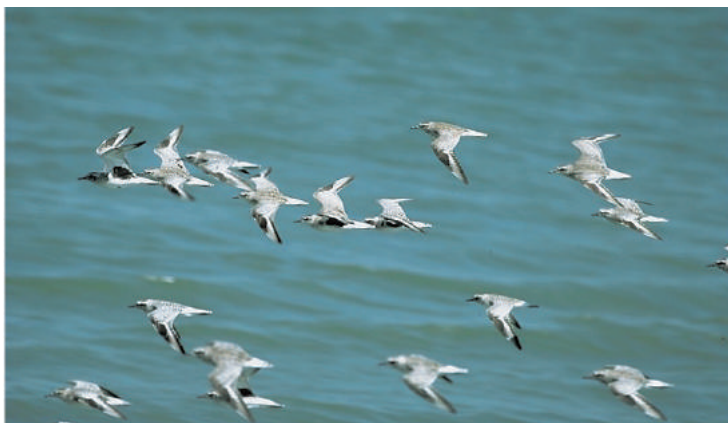
汐川干潟（飛来したダイゼン）