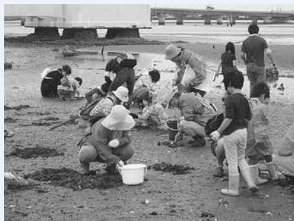
昨年の自然観察会のようす

室名・参加者全員の住所・氏名・ 年齢・電話番号を自然史博物館 (〒441-3147大岩町字大穴 1-238)