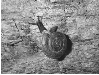
講座④ 豊橋市はカタツムリの宝庫