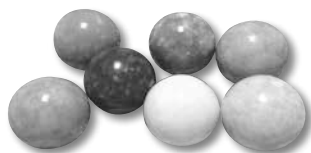
講座⑩ だろ団子(作品例)