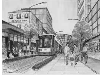
講座⑧ 市電の魅力に迫る