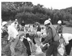
昨年の水防訓練の様子