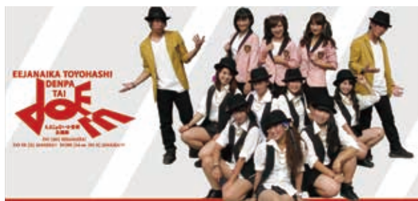
ええじゃないか豊橋伝播隊 DOEE

とき 6月25日(土)・26日(日) ところ こども未来館ここにこ（松葉町三丁目） 内容など イベント／下表、講座／3・4ページ その他 詳細は各地区市民館などで配布のチラシまたはホームページ参照