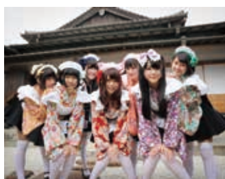
ほの国ぐるめいど隊