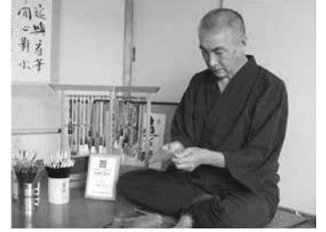
講座⑨ 豊橋筆を知る