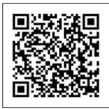
データヘルス計画 QRコード