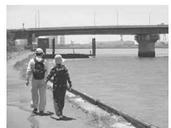
ウォーキングのようす

とき:6月5日(日)午前8時30分~午後1時(ウォーキング受け付けは午前11時まで) ところ:カモメリア(神野ふ頭町) 内容:港周辺のウォーキング(7km・3km・1km)と職業体験(警察官、消防士など)・竹島移動水族館などの子ども向けイベント 持ち物:タオル、飲み物、弁当(必要な方) その他:完歩賞あり。子ども向け完歩賞は当日イベント体験券。健康マイレージ対象事業 問い合わせ:みなと振興課(☎34・3710)