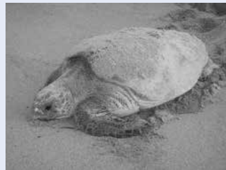
表浜海岸から海に帰るアカウミガメ