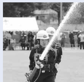
昨年度の大会の様子