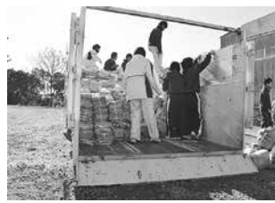
地域資源回収の様子

実施団体: 自治会、小・中学校PTA、子ども会、女性会、老人クラブなど 回収品目: 新聞・チラシ、雑誌(雑がみを含む)、ダンボール、牛乳パック等、布、アルミ缶、スチール缶など(実施団体により異なります) その他: 回収日など詳細はホームページ参照。実施団体には回収量に応じて奨励金が交付され、奨励金は備品の整備や親睦行事などの地域活動に使われます 問い合わせ: 環境政策課(☎51・2399)