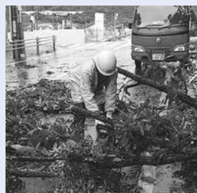
災害対応中の消防団員

消防団員は、日頃は別の仕事をしながら災害時に活動を行い、地域の安全・安心を守っています。これからの季節、大雨や台風などによる被害が懸念され、被害を最小限に抑えるため、消防団員は河川の巡視や道路冠水、土砂災害などの警戒にあたります。