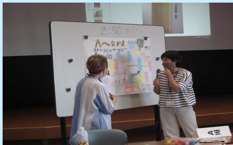
気づきの共有(グループワーク)・発表