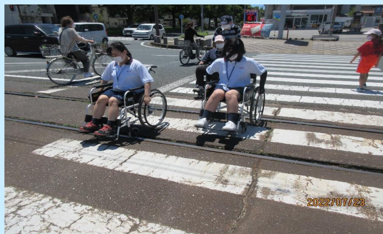
車いす体験・バリアフリー調査