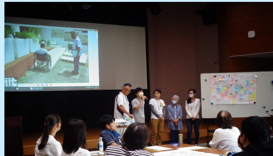
気づきの共有(グループワーク)・発表