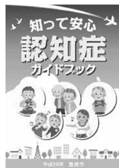
認知症ガイドブック

とき: 9月11日(日)午前10時～11時30分 ところ: つつじが丘地域福祉センター(佐藤五丁目) 対象: 市内在住・在勤の方 内容: 認知症ガイドブックを活用し、早めの気づきと対応・暮らし方について考えます 講師: 認知症地域支援推進員 定員: 40人(申込順) その他: 参加者に認知症ガイドブックを配布 申し込み: 8月15日～9月7日に住所、氏名、電話番号を豊橋市東部地域包括支援センター(☎64・6666)