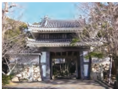
田原城の桜門(復元)

とき: 10月3日(月)～12月22日(木)(土・日曜日、祝日を除く)午前9時～午後5時 ところ: 文化財センター(松葉町三丁目) 内容: 吉田城・田原城など東三河の近世城郭をパネルや出土品で紹介します 問い合わせ: 文化財センター(☎56・6060)