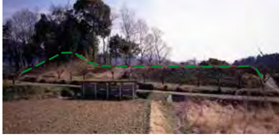
横から全景を見ると、前方後円墳の形がよく分かります