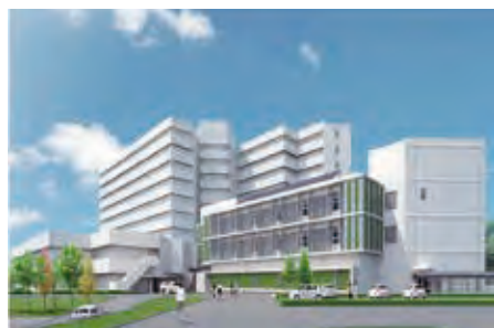
高度放射線棟(完成イメージ)

シミュレーション研修センターは、実 技を磨く「スキルスラボ」と座学を行う 「セミナー室」で構成された、医師や看 護師らの臨床技能教育を行う部門です。 採血や点滴など、基本的な医療行為に 加え、救急処置、内視鏡検査など高度 な医療行為も当センターでは、あらか じめ人体構造や機能を再現したシミュ レータや視覚教育設備を用いて十分 な訓練を行うことができます。このよ うな設備は大学附属病院では完備され ていますが、一般病院での設置はほと んどなく、全国に先駆けた施設です。