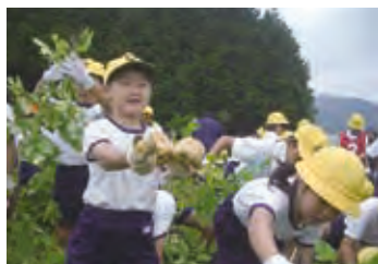
縦割り班によるジャガイモ掘りのようす(高山小学校)