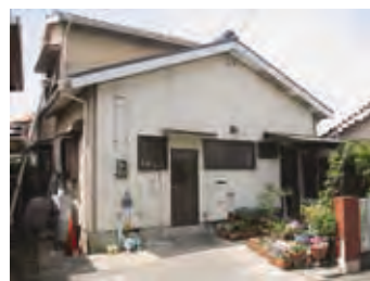
売却区分番号1の物件

入札期日: 11月14日(月)午前10時～10時30分 入札場所: 市役所税務相談室(西館2階) 代金納付期限: 11月21日(月)午後2時30分 その他: 滞納市税完納などにより公売が中止になる場合あり。詳細はホームページ参照 申し込み: 9月15日～11月4日に身分証明書、印鑑を持参して市役所納税課(西館2館 ☎51・2255)