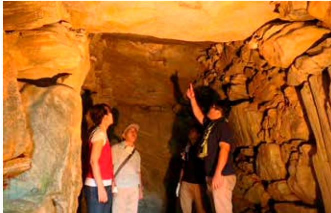
石室内のようす。石の柱で3つに仕切られています。一番奥の巨大な一枚岩と、三河地方の特徴であるドーム状の天井に注目