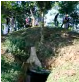
古墳の上を実際に歩いてみると、中央が麦わら帽子のように大きく盛り上がっている特徴的な形がよく分かります