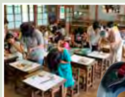
世界にひとつだけの 勾玉づくり

とき：10月15日(土)・16日(日)午前9時～午後5時 ところ：文化財センター（松葉町三丁目） 内容：勾玉や貝のプレスレット作りができます 入館料：無料（材料費として勾玉は500円、貝は100円が必要）