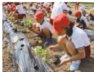
枝豆の苗を定植するようす(下条小学校)