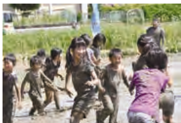
田植え前に全校児童でどろんこ体験をしているようす(賀茂小学校)

※特認校では、長期休業期間などを除き午後6時(高山小は午後5時30分)まで放課後子ども教室に、子どもを預けることができます