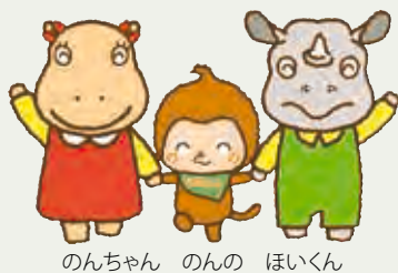
のんちゃん のんの ほいくん

休園日 月曜日(月曜日が祝・休日の場合は翌平日) 参加料 無 料(総合動植物公園入園料必要) 駐車料金 普通車200円、中・大型車400円