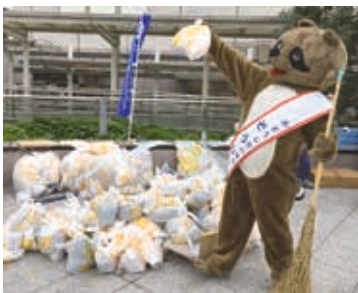
「そうじろう」と一緒に参加しよう

とき 11月5日(土)～14日(月) 内容 11日の豊橋市民の日を含む期間中、市内一斉の清掃活動を実施します その他 事前に計画書を提出した方に、市制110周年を記念して作成した、ひまわり柄の「530アートごみ袋」を進呈します※計画書は市役所環境政策課(西館5階)で配布 問い合わせ 530運動環境協議会事務局(環境政策課内)☎51・2454