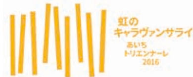
あいちトリエンナーレ2016 ロゴマーク

とき: 10月8日(土)～10日(日)午前11時30分、午後1時・3時30分・5時 ところ: 公会堂(八町通二丁目) 内容: アローラ&カルサディーラ監修によるヴォーカルパフォーマンスです 定員: 各50人(先着順) 入場料: あいちトリエンナーレ2016国際展チケットの提示が必要。中学生以下は無料 その他: 詳細はあいちトリエンナーレ2016ホームページ参照 問い合わせ: あいちトリエンナーレ実行委員会(☎052・971・6111)、市役所文化課(☎51・2873)