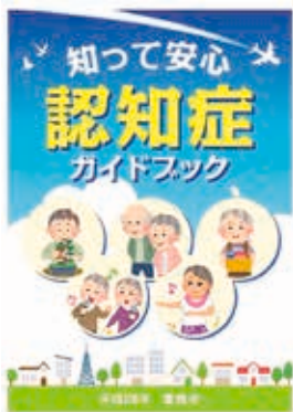
認知症ガイドブック

とき: ①10月23日(日)午前10時～11時30分 ②11月12日(土)午後1時30分～3時 ところ: ①大清水地域福祉センター(大清水町字大清水) ②あイトピア(前畑町) 対象: 市内在住・在勤の方 内容: 認知症ガイドブックを活用し、早めの気づきと対応・暮らし方について考えます 講師: 認知症地域支援推進員 定員: 各40人(申込順) その他: 参加者に認知症ガイドブックを配布 申し込み: ①は10月21日までに豊橋市南部地域包括支援センター(☎25・7100)、②は11月11日までに豊橋市中央地域包括支援センター(☎54・7170)