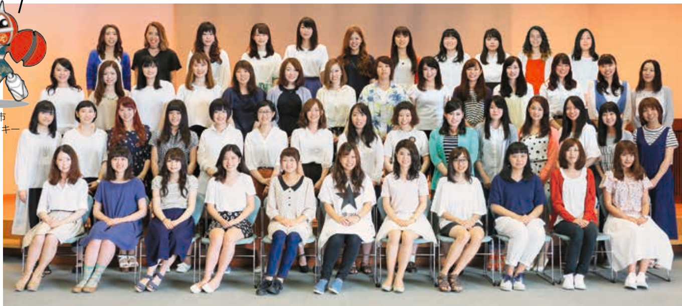
※詳細は「豊橋まつりガイドブック」参照

「豊橋まつりクイーン」は今年で57代目。各校区の自治会から推薦された健康で明るい51人のクイーンが、豊橋まつり当日の各行事に参加し、素敵なダンスを披露します。