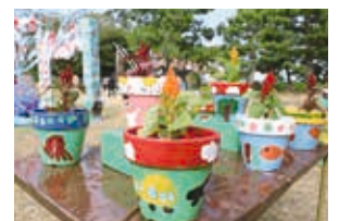
野外作品展のようす

その他、豊橋公園内では2日間にわたり、観光物産博覧会、農産物博覧会を開催するほか、ちびっこミニ新幹線や、わいわい消防広場など、楽しいイベントが盛りだくさんです。詳細は、本紙と同時配布などの「豊橋まつりガイドブック」をご覧ください。