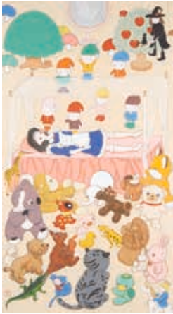
山本太郎 「白雪姫ニルヴァーナ」 2016年

とき 10月29日(土)～12月11日(日)午前9時～午後5時(月曜日休館)。10月29日は正午から) ところ 美術博物館(豊橋公園内) 観覧料 一般800円、小・中・高校生400円 その他 講演会、ワークショップなどの詳細はホームページ参照 問い合わせ 美術博物館(☎51・2882)