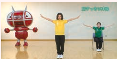
「ええじゃないか豊橋 ほの国体操」シャキシャキバージョン

対象 老人クラブ・サロン・趣味活動などグループ活動をしている、または、これから体操を続けたい方 内容 ほの国体操を考案した理学療法士などから、体操のポイントを学びます 定員 50人(申込順) その他 DVDと体操に使えるゴムバンドを進呈します 申し込み 10月14日までに長寿介護課(☎51・2338)