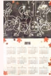
おやこ造形あそび (作品例)

上記のほか、親子対象の「運動あそび」「おやこ造形あそび」「めざせ!わっぱなし」「リトミックあそび」「おやこヨガ」「おやこふれあい体操」や、0～3歳児と保護者対象の「つどいの広場」を定期開催しています。日程など詳細は交通児童館だより、またはホームページをご覧ください。