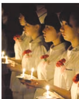
昨年の戴帽式の様子

とき: 10月26日(水)午後2時～3時 ところ: 市立看護専門学校(青竹町字八間西) 内容: 学生たちがナースキャップを受け取る戴帽式を見学できます その他: 公共交通機関をご利用ください 申し込み: 10月25日までに市立看護専門学校(☎33・7891)