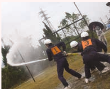
放水競技大会の様子

自衛消防隊は緊急時に消火活動や救助活動を行い、自らの職場を守ります。また、従業員への防火教育などを通して、災害対策を行っています。