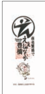
「千客万来」 目印のお札

フェイスペイントをして協力店舗（130店舗以上）に来店すると、さまざまな割引や特典が受けられます。協力店舗のチラシも各案内所で配布するほか、無料でフェイスペイントができるブースもまちなかや豊橋公園などに設置します。