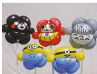
バルーンアート(作品例)

とき：①11月5日・19日、12月3日・17日の土曜日②11月6日・20日、12月4日・18日の日曜日(各全4回)午後1時30分～3時 対象 ：バルーンアートで犬などを作れる方(小学生は保護者同伴) 内容 ：風船でキャラクターや恐竜、リースなどを作ります 定員 ：各10人(申込順) 参加料 ：無料(材料費各2,000円必要) 持ち物 ：マジックペン、物差し、はさみ、作品を入れる大きなポリ袋 申し込み ：10月8日午前9時から視聴覚教育センター