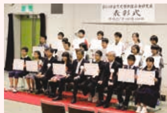
昨年の授賞式の様子

とき 10月8日(土)～11月6日(日) 内容 市内の小・中学生が行った 自由研究の優秀作品を展示します