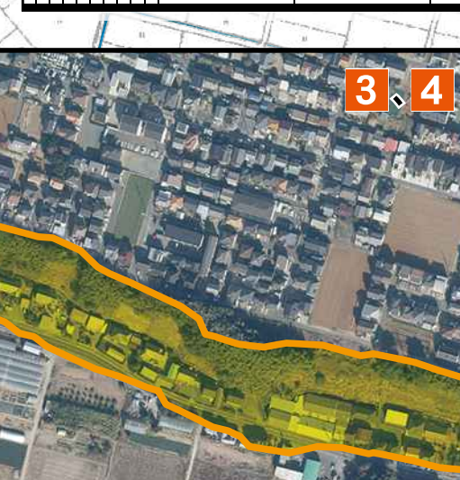
3, 4 航空写真