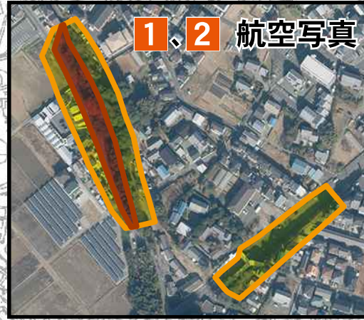
1, 2 航空写真