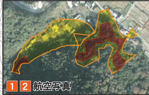
1 2 航空写真