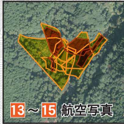
13 ~ 15 航空写真