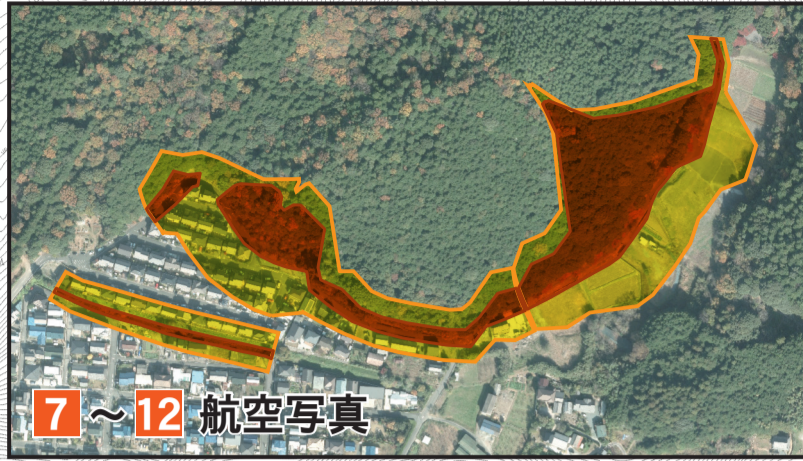
7 ~ 12 航空写真