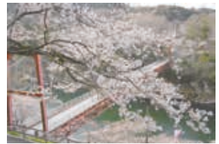
新城さくらまつり(新城市)