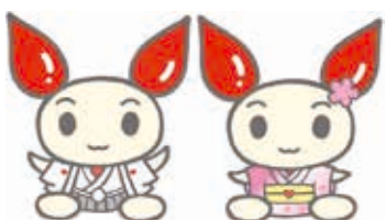
献血推進キャラクター「けんけつちゃん」

とき: 1月1日(祝)～2月28日(火) 問い合わせ: 愛知県赤十字血液センター豊橋事業所(☎32・1331)、市役所福祉政策課(☎51・2355)