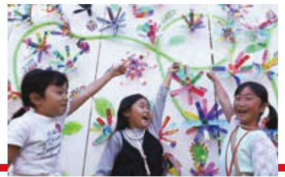
子ども造形パラダイス(昨年のように)