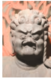
木造不動明王立像