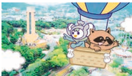
ピカピカ☆キラリン