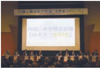
昨年度の外国人集住都市会議の様子