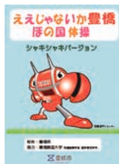
ええじゃないか豊橋 ほの国体操DVD

高齢者の介護予防・健康づくりに役立つ 健康体操「ええじゃないか豊橋 ほの国体 操」のDVDを無料で貸し出しています。 貸出期間:2週間 貸出場所:各地区・ 校区市民館、市役所長寿介護課(東館3 階)※ホームページでも閲覧可 問い合 わせ:長寿介護課(☎51・2338)