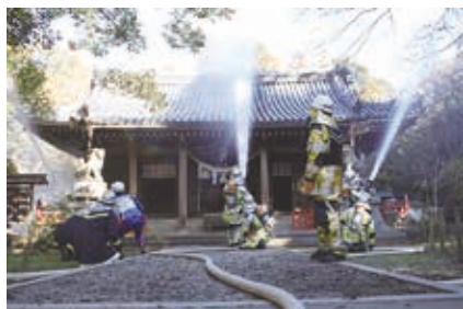
昨年の文化財消防訓練の様子

とき:1月20日(金)午前10時 ところ:駒屋 (二川町字新橋町) 問い合わせ:消防 本部予防課(☎51・3115)