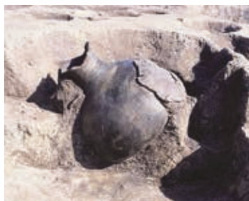
西浦遺跡で出土した土器

とき: 1月10日～4月14日の月～金曜日 午前9時～午後5時(2月18日(土)は特 別開館) ところ: 文化財センター(松葉 町三丁目) 内容: 県が市北部で行った 発掘調査成果と、周辺の発掘調査を紹 介します 問い合わせ: 文化財センター (☎56・6060)