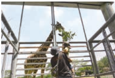
前回のプレミアムガイド(キリンのエサやり体験)の様子