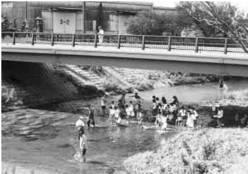
梅田川ふれあいクリーン作戦