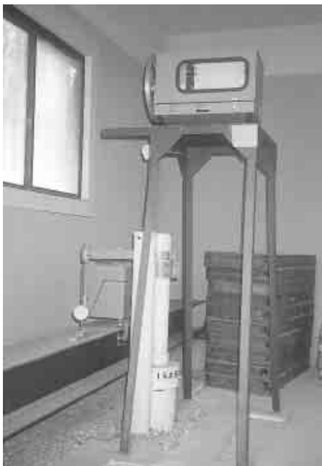
地盤沈下・地下水位調査

本市は、地下水の揚水規制地域に該当していないが、県民の生活環境の保全等に関する条例により、揚水量を報告しなければならない地域となっている。また、地下水の過剰揚水は、地下水位の低下や塩水化ひいては地盤沈下の要因となるため、本市では調査を継続している。