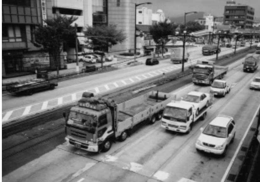
自動車交通の状況

本市は、騒音規制法、振動規制法、悪臭防止法及び県民の生活環境の保全等に関する条例の規定に基づき、関係工場等の監視・指導、環境騒音調査並びに国道1号などの自動車騒音・道路交通振動調査等を実施した。