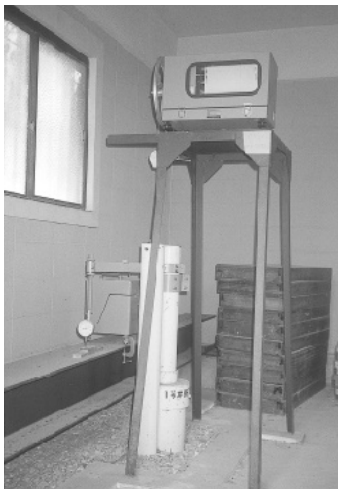
地盤沈下・地下水位調査

本市は、地下水の揚水規制地域に該当していないが、県民の生活環境の保全等に関する条例により、揚水量を報告しなければならない地域となっている。また、地下水の過剰揚水は、地下水位の低下や塩水化ひいては地盤沈下の要因となるため、本市では調査を継続している。