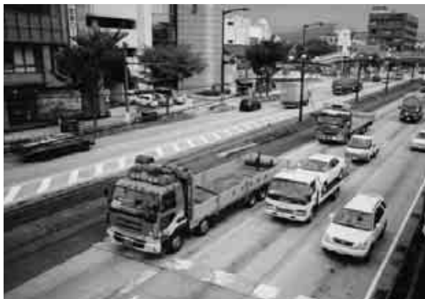
自動車交通の状況

本市は、騒音規制法、振動規制法、悪臭防止法及び県民の生活環境の保全等に関する条例の規定に基づき、関係工場等の監視・指導、環境騒音調査並びに国道1号などの自動車騒音・道路交通振動調査等を実施した。