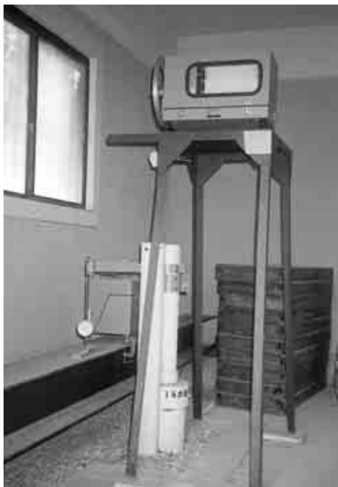
地盤沈下・地下水位調査

本市は、地下水の揚水規制地域に該当していないが、県民の生活環境の保全等に関する条例により、揚水量を報告しなければならない地域となっている。また、地下水の過剰揚水は、地下水位の低下や塩水化ひいては地盤沈下の要因となるため、本市では調査を継続している。