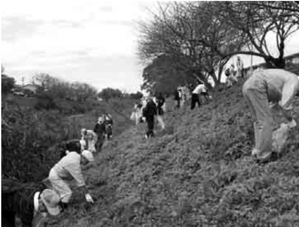
梅田川ふれあいクリーン作戦