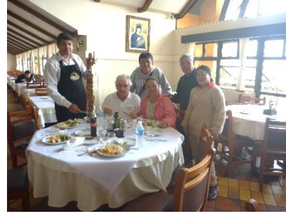
各夫婦と肉と共に