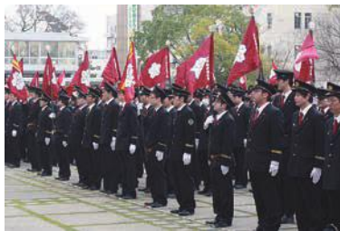
消防団観閲式(昨年のような)

①市役所市民広場(東館正面玄関前) ②公会堂(八町通二丁目) 内容: 市長による消防団員、車両の観閲と消防関係者の表彰式 問い合わせ: 消防本部総務課(☎51・3111)