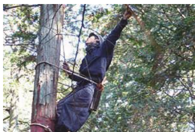
檜皮剥ぎのようす

とき: 2月25日(土)午前10時、午後2時(雨天順延26日(日)) 集合・解散: 賀茂神社本殿前(賀茂町字神山) 問い合わせ: 文化財センター(☎56・6060)、賀茂神社(☎88・3359)