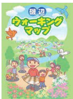
ウォーキングマップ (磯辺校区)

とき: 2月1日(水)～28日(火) ところ: 保健所・保健センター(中野町字中原「ほいっぷ」内) 内容: 市民と作成した校区ウォーキングマップなどを展示します その他: マップの配布あり(数量限定) 問い合わせ: 健康増進課(☎39・9145)