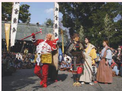
赤鬼と天狗のからかいのようす