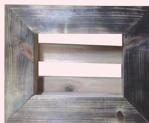
額縁コンテナ(作品例)

郵便番号・住所・氏名・電話番号 市外在住の方は勤務先を豊橋みどりの協会(〒441-3147 大岩町字大穴1-238)