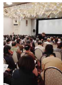
昨年のとよはしまちなかスロータウン映画祭のようす

婦・家族を考える映画、見終わって気持ちが良い・考えさせられるものを中心に、新作から旧作、邦画から洋画まで、さまざまな種類を選んで上映しています。