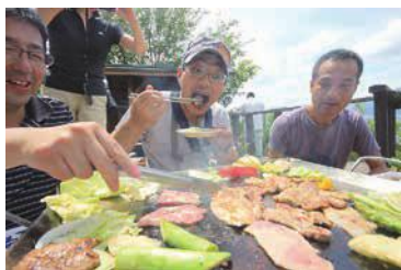
出前焼肉のようす