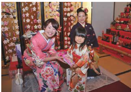
ひなあられプレゼント(昨年のようす)

■琴の演奏会 とき:3月12日(日)午前11時 出演:二川南小学校 和楽器クラブ [共通事項] ところ:二川宿本陣資料館(二川町字中町) 参加料:無料(入館料必要) 問い合わせ:二川宿本陣資料館(☎41・8580)