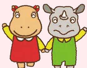
のんちゃん ほいくん

休園日 月曜日(月曜日が祝日の場合は翌平日) 参加料 無料(総合動植物公園入園料必要) 駐車料金 普通車200円 中・大型車400円