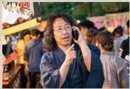
2日間かけて、会場を歩きながらスマートフォンで店舗名を収録。自宅に紙におこして地図を作り上げる。