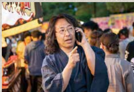
2日間かけて、会場を歩きながらスマートフォンで店舗名を収録。自宅で紙におこして地図を作り上げる。