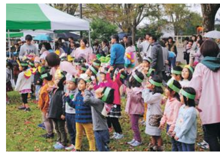
むろ◎しおたスマイルフェスティバルに参加する保育園児。