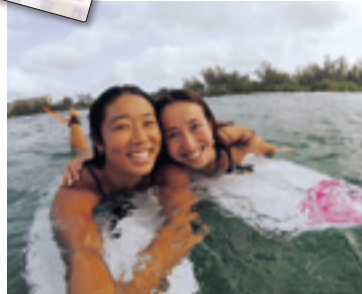
サーファー友達とサーフィン。一緒に海に入ると楽しい!