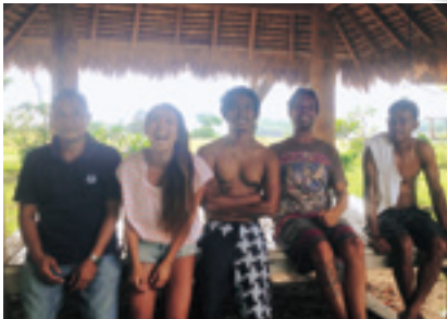
国内はもちろん、海外へサーフトリップに行くことも!