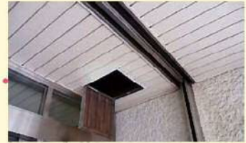
玄関横シャッター周り