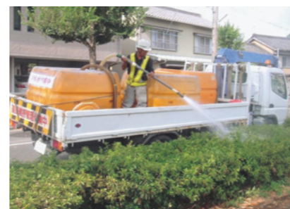
下水処理水の利用