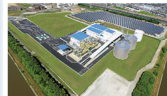
バイオマス利活用センター全景