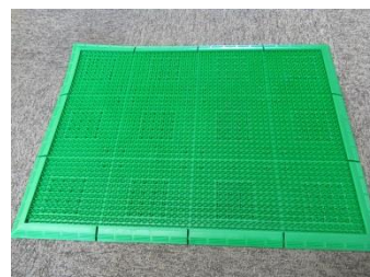
種子を落とすマット