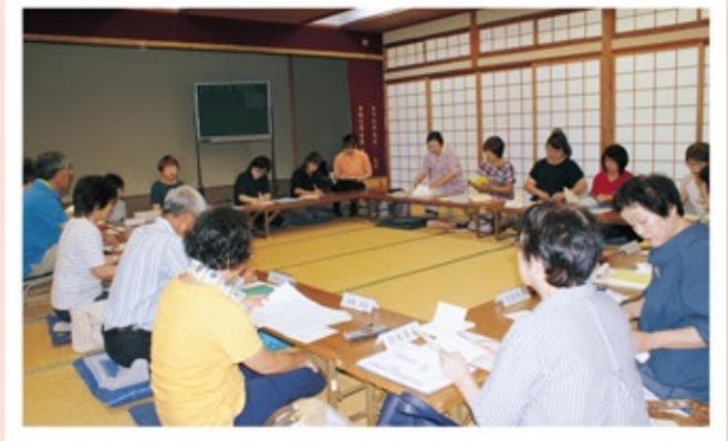
▲幸校区民生委員会議

民生委員は、地域の高齢者がいきいき元気に暮らしていけるよう応援したり、子どもたちの健やかな成長を見守るなど、多彩な活動を行っています。今回のアクティでは、活発な活動を続ける幸校区にスポットを当て、民生委員の活動の様子を紹介します。