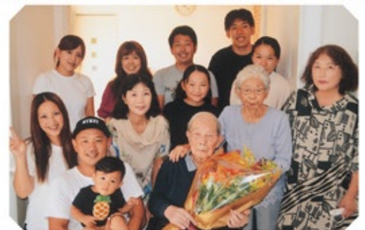
▲百歳のお祝いでは、離れて暮らす家族親族も集まりました。

節ごとの行事やイベントに積極的に参加されていて、人あたりの良さで人気です。長寿の秘訣は?とお聞きしたら「好き嫌いがなく何でも食べることですかね」という返事。特にステーキや唐揚げなど、肉類がお好きなのだとか。