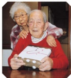
▲仲良し夫婦、いつも一緒です。

節ごとの行事やイベントに積極的に参加されていて、人あたりの良さで人気です。長寿の秘訣は?とお聞きしたら「好き嫌いがなく何でも食べることですかね」という返事。特にステーキや唐揚げなど、肉類がお好きなのだとか。