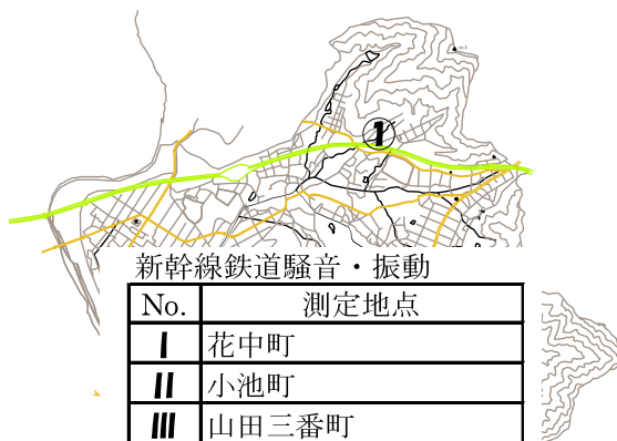
新幹線鉄道騒音・振動