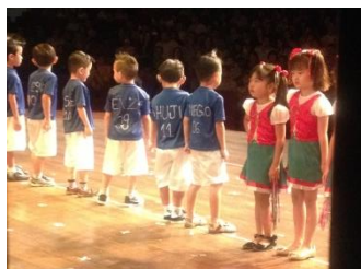
年長 (5歳児) イタリア

卒業式では、幼稚園の年長さんと5年生が卒業証書をもらいました。年長さんは続けてめぐみ学園の小学校に入学する子が多いですが、小学校は5年生までしかないので、次はみんな違う学校に進学します。この日は発表会も兼ねていました。発表会の今年のテーマは、来年2014年にブラジルで行われる「W杯サッカー」でした。今までの開催国を各クラスが担当し、その国にちなんだ歌やダンスを発表しました。この日のために約3週間毎日練習していました。衣装やメイクもバッチリでした。近くの劇場を借りて盛大に行われました。