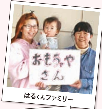
はるくんファミリー