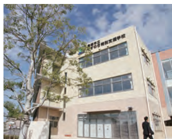
くすのき特別支援学校