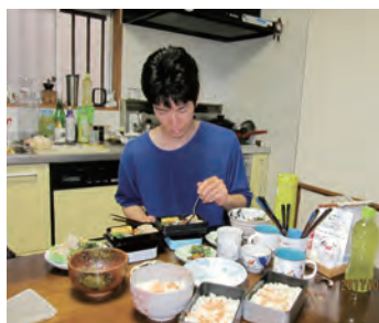
昨年の最優秀賞「朝活 弁当作りはじめました。父と兄の分も作ってます。」