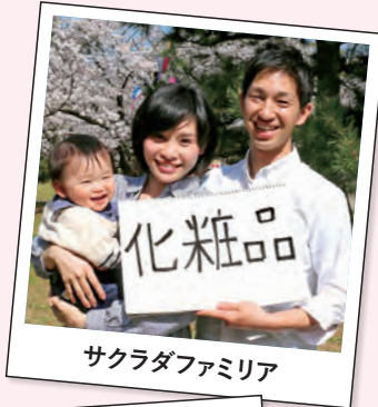
サクラダファミリア