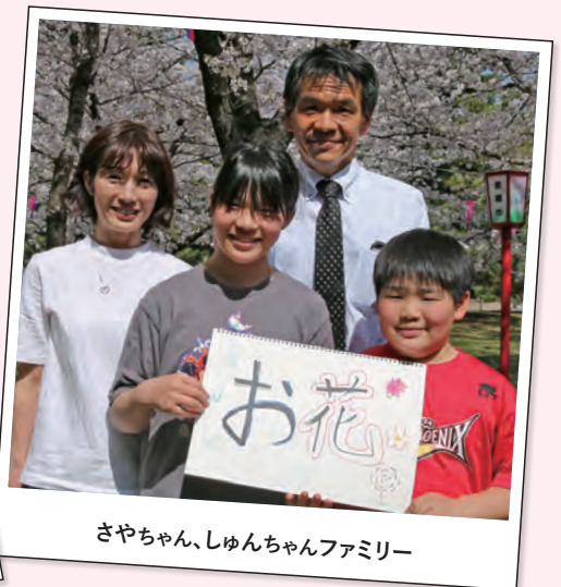
さやちゃん、しゅんちゃんファミリー