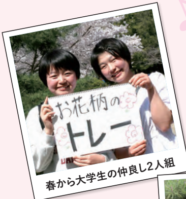
春から大学生の仲良し2人組

こんな素晴らしい藤の乳母車、みなさんの疑問は「どこで買えるの?」ではないでしょうか。ご心配なく、豊橋には今でも藤の乳母車を作っているお店が二川駅前にあります。もちろん製造直売していますので、ぜひお店をのぞいてみてください。